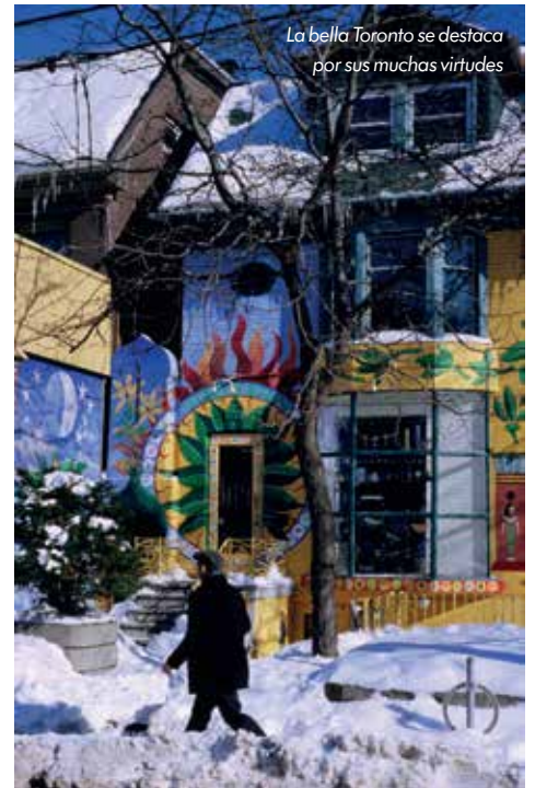
La bella Toronto se destaca por sus muchas virtudes